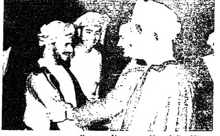
نائب الرئيس المصري يصافح سمو السيد حمد بن حمود

وقوي جدا . ما هو الضعيف بالنسبة للتضامن العربي ؟ اما عن موقف اليمن الجنوبي فقد تسال السيد حصتي مبارك قائلا : منذ متى كان يعرف شيئا عن القضية . لم تسمع ان لليمن الجنوبي علاقة بالقضية الا بعد ان تواجد السوفييات عندهم لماذا لم يتكلموا عن القضية قبل ذلك ؟ الحقيقة التضامن العربي قوي جدا ويخبر ولا يخشى عليه . جميع الدول العاقلة التي تفكر التفكير المنطقي السليم تؤيد مبادرة السادات سواء اعلنت او لم تعلن ، كل دولة لها اسلوب في العمل ، هناك دول تحب ان تعلن وتوضح رايها ، وهناك دول تؤيد ولكن لا تعلن عن ذلك لظروف او لآخرى ونحن في مصر لا نجبر